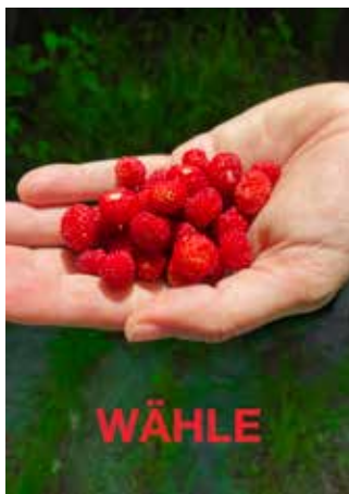
Almut Linde, o. T., 2021