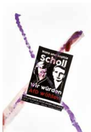
Stefanie von Schroeter, Seite 36