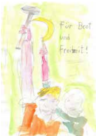
Peter Friedl, o. T., 2013